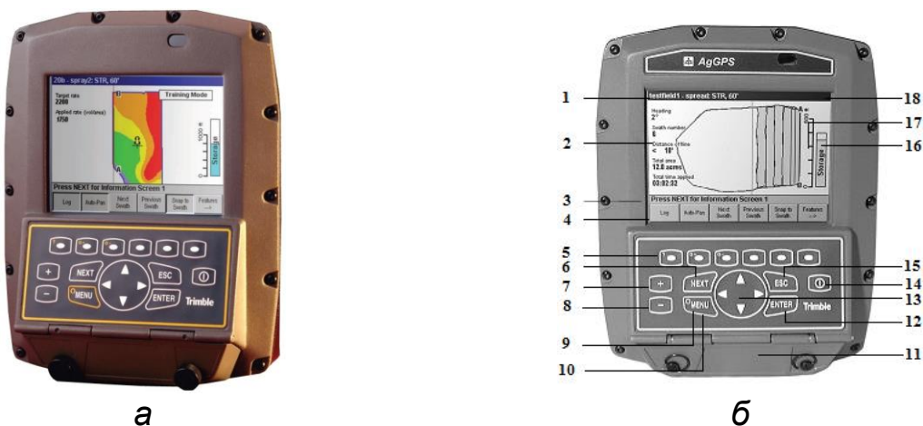
Рисунок 7.5 – Полевой компьютер AgGPS 170

(а – общий вид; б – передняя панель компьютера):