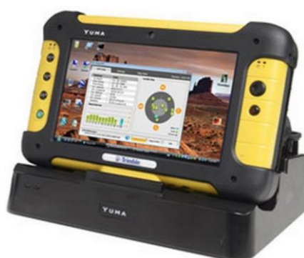
Рисунок 7.2 – Планшетный компьютер Yuma