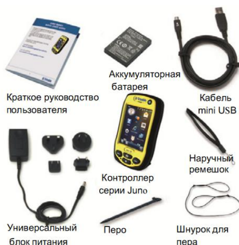
Рисунок 7.6 – Комплект поставки контроллера серии Juno