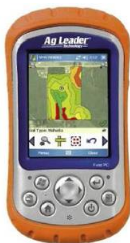
Рисунок 7.4 – Полевой компьютер SMS Mobile